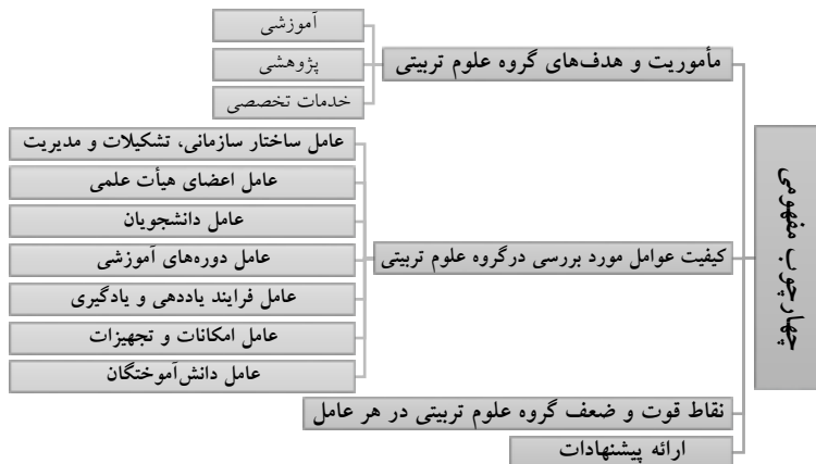
شکل (۱) چهارچوب مفهومی پژوهش

نتایج نشان داد نمره‌های ارزیابی داخلی با نمره‌های ارزیابی خارجی به جز در عوامل: مأموریت و هدف‌های مدرسه، برنامه درسی و برنامه‌های توسعه در بقیه موارد، متفاوت است و در ۳ دانشکده از ۵ دانشکده در مورد عوامل دانشجویان و امکانات و فناوری ارزیابی‌های خارجی نسبت به ارزیابی‌های داخلی مثبت‌تر بود. همچنین، ریگنستریف و همکاران ۱ (۲۰۰۴، ص ۲۵۷) پژوهشی درباره تأثیر ارزیابی درونی اجرا کردند که زیر نظر دانشگاه واشینگتن در آموزش پزشکی و در حوزه کنترل ایدز صورت گرفته است. یافته‌های این پژوهش نشان می‌دهد که اساساً فرایند ارزیابی درونی برای اثربخشی به روش‌های متنوع کیفی‌تری مانند مشاوره با خبره‌ها نیازمند است. جورژیو و راسنر ۲ (۲۰۰۰، ص ۶۵۸) نیز ارزیابی‌های درونی دانشگاهی را از منظر ارتقای کارایی‌ها و اثربخشی برنامه‌ریزی‌های دانشگاهی برای بازار کار و صنعت و نبود قابلیت مقایسه مورد نقد قرار داده‌اند. یافته‌ها بر ضرورت شبکه‌سازی برون‌دانشگاهی برای گرفتن بازخوردهای شناختی از تقاضاها، به منظور تعمیق ارزیابی‌های درونی آکادمیک تأکید دارد. درنهایت، چهارچوب مفهومی پژوهش حاضر در شکل (۱) ترسیم شده است.