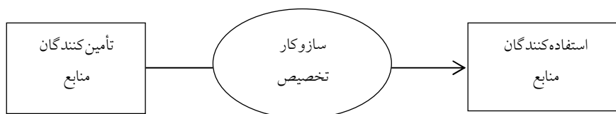
شکل (۱) فرایند تأمین و تخصیص منابع مالی در نظام‌های آموزشی