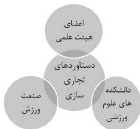
شکل (۱) مدل مفهومی پژوهش

را شروع می کنند و در مرحله دوم، این دانشگاه است که با حمایت و پشتیبانی از ایده های اعضای هیئت علمی بستر لازم برای تجاری سازی را فراهم می کند و در گام سوم، صنعت ورزش از این ایده ها بهره می برد و در صورت دارا بودن شرایط لازم آنها را وارد مرحله تجاری سازی و کاربردی کردن می کند. بر این اساس، در این پژوهش، شناسایی دستاوردهای تجاری سازی تحقیقات دانشگاهی در حوزه ورزش برای اعضای هیئت علمی، شناسایی دستاوردهای تجاری سازی تحقیقات دانشگاهی در حوزه ورزش برای صنعت ورزش و شناسایی دستاوردهای تجاری سازی تحقیقات دانشگاهی در حوزه ورزش برای دانشگاه مد نظر است؛ و در نهایت به این پرسش ها پاسخ داده می شود که دستاوردهای تجاری سازی تحقیقات دانشگاهی در حوزه ورزش برای اعضای هیئت علمی کدامند؟ دستاوردهای تجاری سازی تحقیقات دانشگاهی در حوزه ورزش برای صنعت ورزش کدامند؟ دستاوردهای تجاری سازی تحقیقات دانشگاهی در حوزه ورزش برای دانشگاه کدامند؟