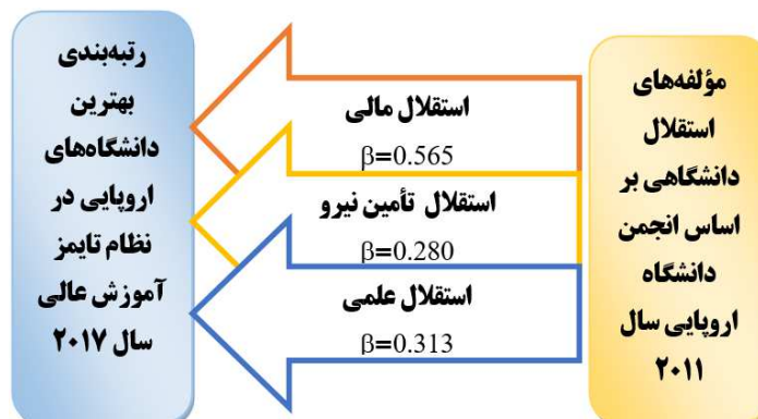
نمودار (۲) مدل پیش‌بینی وضعیت در رتبه‌بندی دانشگاه اروپایی بر اساس ابعاد استقلال دانشگاهی

در مجموع از آنجا که ضرایب رگرسیونی، حاکی از پیش‌بینی رابطه معنی‌دار بین ابعاد استقلال مالی، استقلال علمی و استقلال در تأمین نیرو است، مدل نهایی پژوهش به‌صورت نمودار (۲) تعدیل می‌شود: