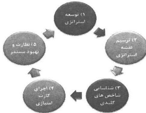
شکل (۱) مراحل تشکیل و اجرای کارت امتیازی متوازن