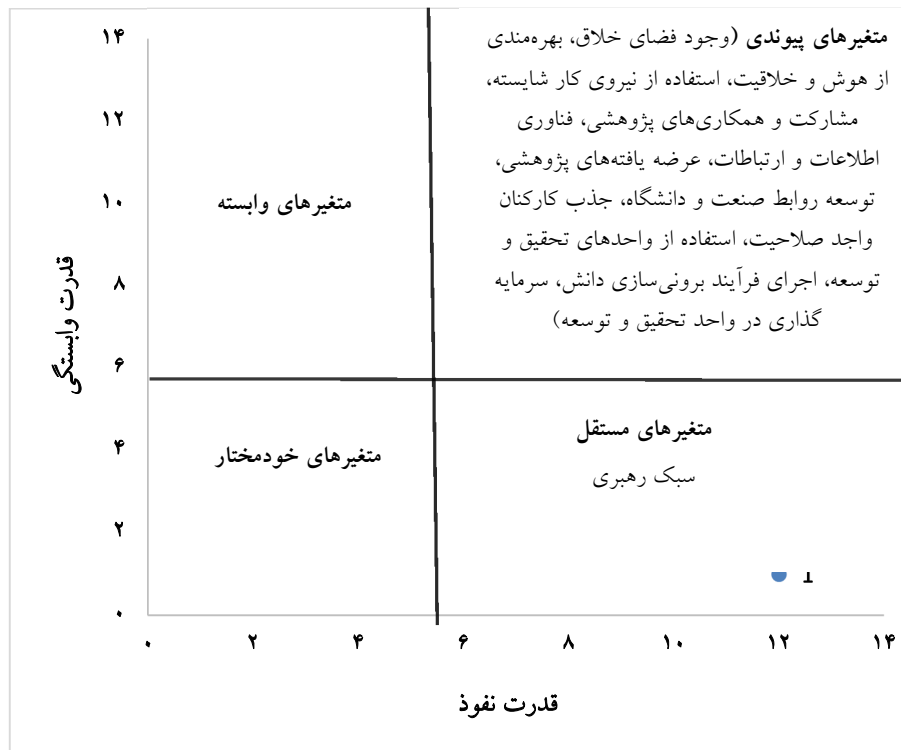
شکل (۳) ماتریس قدرت نفوذ-وابستگی

۴ و به‌عنوان زیربنای مدل شناخته می‌شود. در سطح اول نیز عواملی قرار گرفته که کمترین میزان تأثیرگذاری و بیشترین میزان اثرپذیری را دارند. بنابراین اعمال تغییر بر هریک از عوامل موجود در سطح یک مدل و بهبود وضعیت آنها مستلزم آن است تا عوامل سطوح دو، سه و چهار تغییر کرده و بهبودی در آنها حاصل شود. از میان عوامل مؤثر بر موفقیت نوآوری باز، کدامیک از عوامل به تفکیک در هریک از گروه‌های مستقل، خودمختار، وابسته و پیوندی قرار می‌گیرند؟ برای پاسخ به سؤال سوم پژوهش، در بخش تجزیه و تحلیل داده‌ها علاوه بر تعیین سطح هریک از عوامل، در شکل (۳) با عنایت بر میزان قدرت نفوذ و وابستگی عوامل، نوع عوامل مشخص شده است.