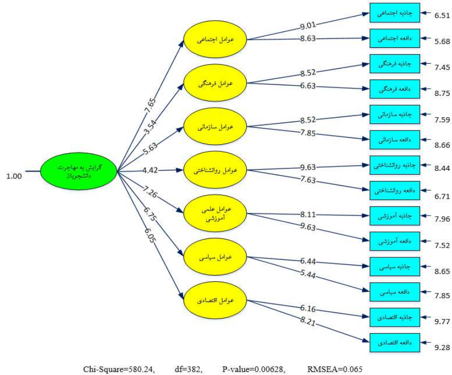
شکل (۳) مدل اندازه‌گیری سازه‌های عوامل مؤثر بر گرایش به مهاجرت دانشجویان نخبه در حالت معنی‌داری

و نشان می‌دهد میانگین مجذور خطاهای مدل مناسب است. شاخص‌های AGFI، GFI و NFI به ترتیب برابر با ۰/۹۱، ۰/۹۰ و ۰/۹۷ است که نشان‌دهنده برازش بالایی می‌باشند.