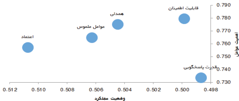
شکل (۳) نتیجه ارزیابی اهمیت-عملکرد (IPA)

برای تمامی عوامل سنجش کیفیت خدمات عملیات فازی زدایی صورت گرفته است. نتایج حاصل از فازی زدایی مقادیر به عنوان داده های نهایی استفاده شد. نتیجه ارزیابی اهمیت-عملکرد برای شاخص های پژوهش حاضر به صورت زیر است: